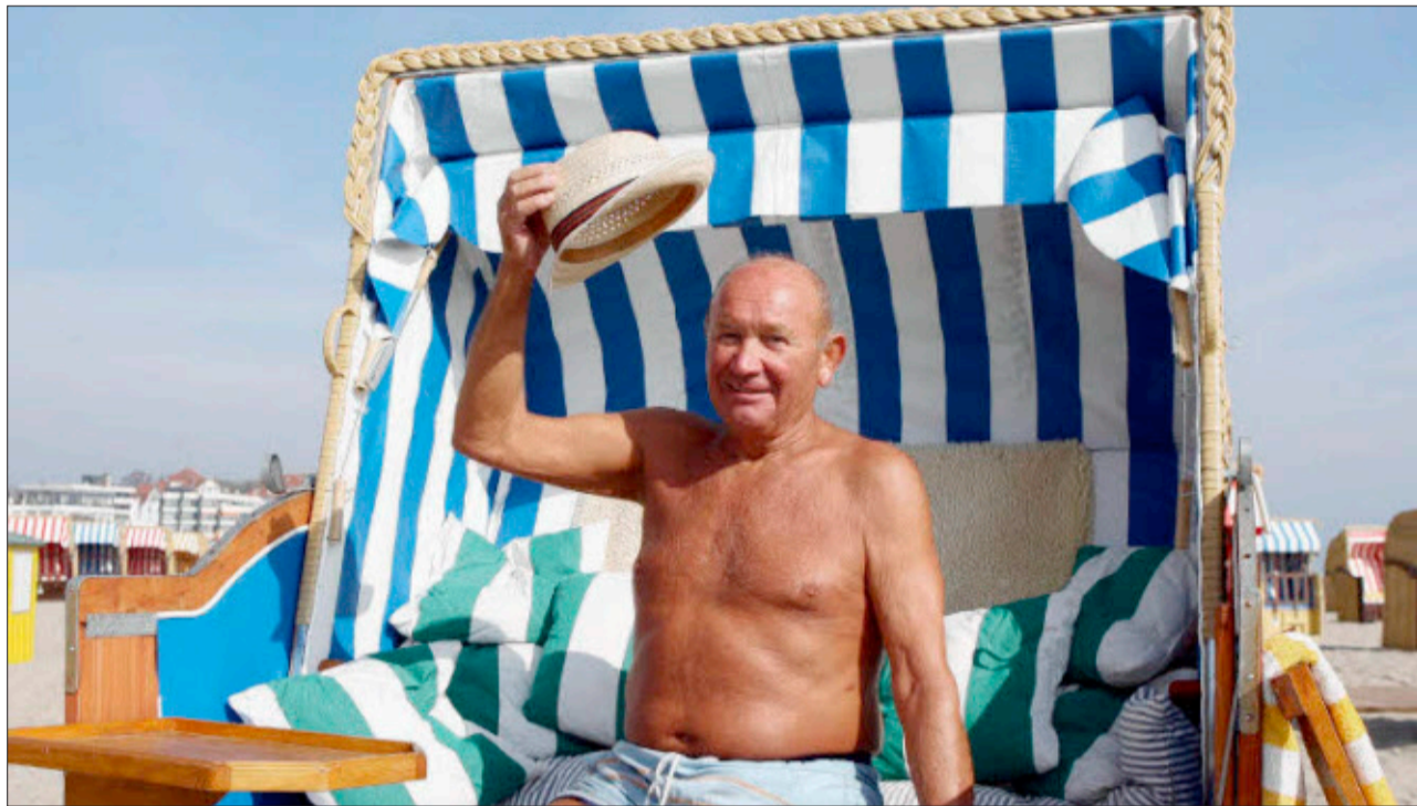
Strandleben allein macht auch nicht glücklich: Wer in den Ruhestand wechselt sucht sich besser beizeiten zufriedenstellendere Tätigkeiten.

Wieder wird sie mit Kindern arbeiten. Die Stelle ist auch ein willkommenes Zubrot: Ihre Rente fällt nicht allzu hoch aus, ebenso wenig die ihres 78-jährigen Mannes, der Verwaltungsangestellter war. Doch sie hat nichts dagegen, weiterhin zu arbeiten, hätte das sogar am liebsten in ih-